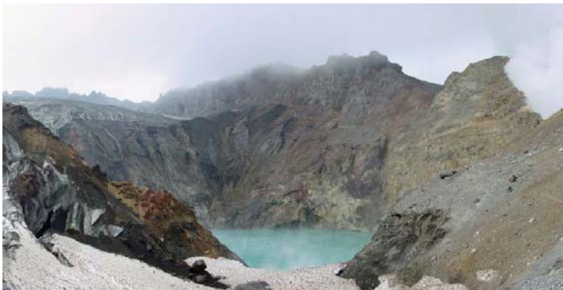
Вид на кратер вулкана Мутновский, 2003 г.

Участники этой однодневной экскурсии поднимутся в кратер вулкана Мутновский и увидят разнообразие современных гидротермальных процессов: фумаролы, кипящие грязевые котлы, горячие кислотные реки и фумарольные поля. В результате этих процессов образуются: самородная сера, алунит, опал, гематит, хлорид аммония, гипс, пирит, марказит, киноварь, халькопирит, пирротин и др.