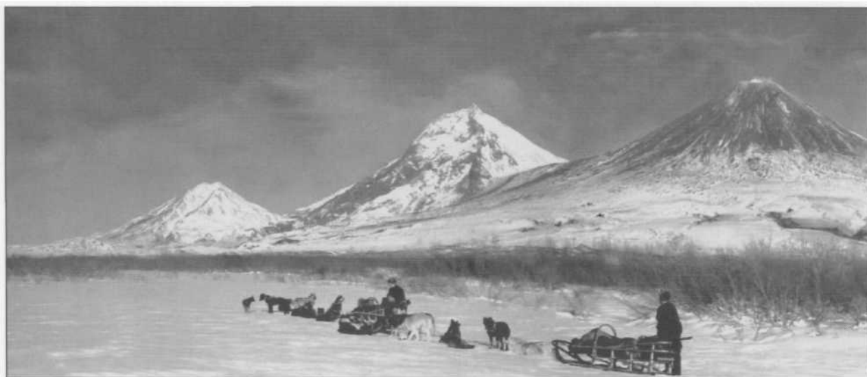
Полевые работы в зимнее время на вулканах Ключевской группы (слева направо: Безымянный, Камень, Ключевской).