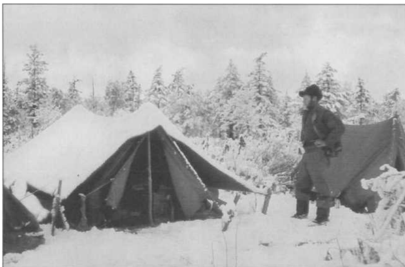
Типичный камчатский ландшафт в конце октября. 1950 г.

ходила также большая подзорная труба для наблюдений за Ключевской группой вулканов и химическая лаборатория. На территории станции помещались конюшня для семи лошадей, баня, склад. Всегда держали две упряжки собак, которые зимой и летом находились на улице на привязи. На реке стояло несколько рыбалок — небольших построек, где рабочие ловили и коптили рыбу для сотрудников и собак.