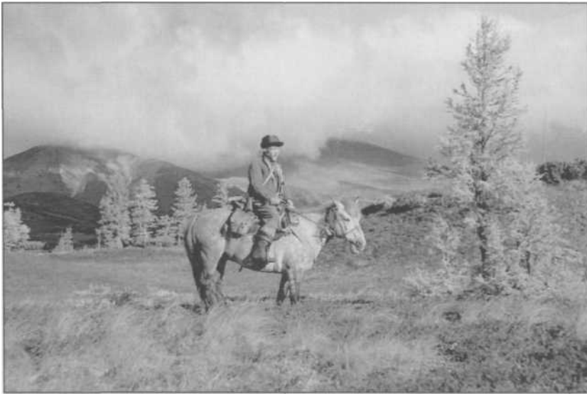
В полной готовности к выезду в маршрут. 1950-е годы.