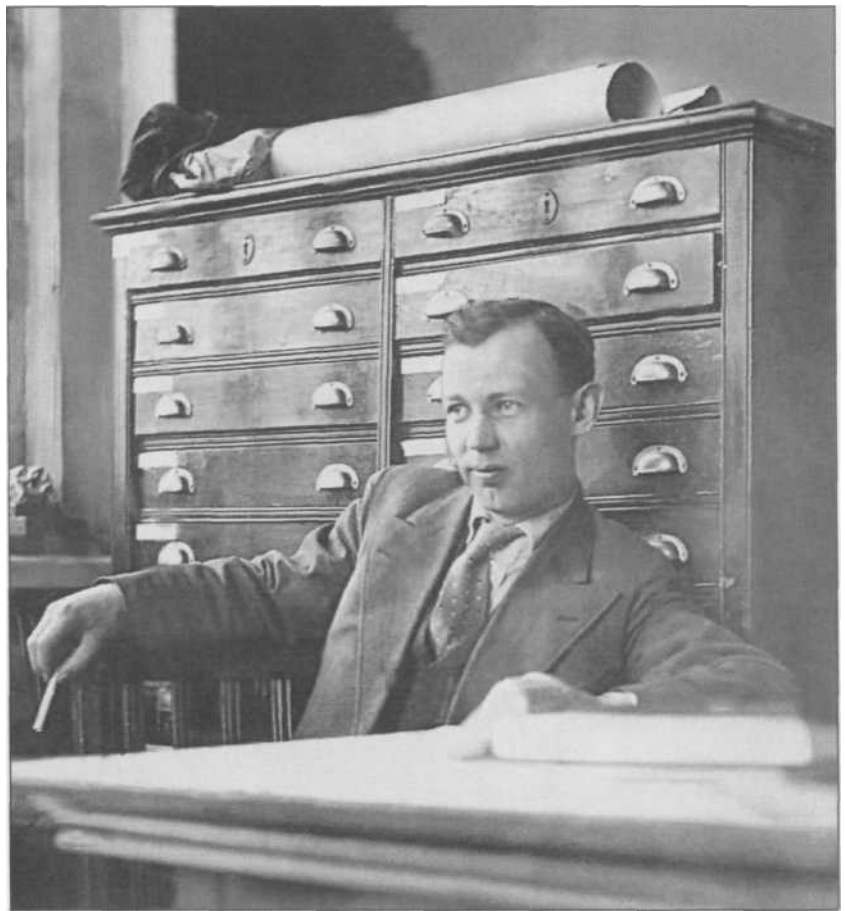
Б.И.Пийп в Ленинградском Горном Институте. 1928 г.

Приходилось испытывать лишения в еде, уже по дороге на Узон закончились крупа, сухари и соль. «Есть нечего — и мясо кончилось. Ребята наварили целое ведро грибов. Каждому пришлось по полной миске. С удовольствием глотали опять эту грибную слизь». Через три дня: «Вечером опять грибы, которых я уже не могу есть, так они опротивели». Но несмотря на отсутствие соли и любой иной пищи, кроме мяса время от времени, все были веселы. Борис Иванович пишет в дневнике: «Под вечер небо стало изумительно чистым. Этот контраст синего неба и зеленых лесистых увалов так сильно меня волнует, что ради этого я готов отдать все радости свои. <...> И тут стал ощущаться соленый запах моря. Вернее, даже не моря, а океана, величественного Тихого океана. Через несколько минут мы были