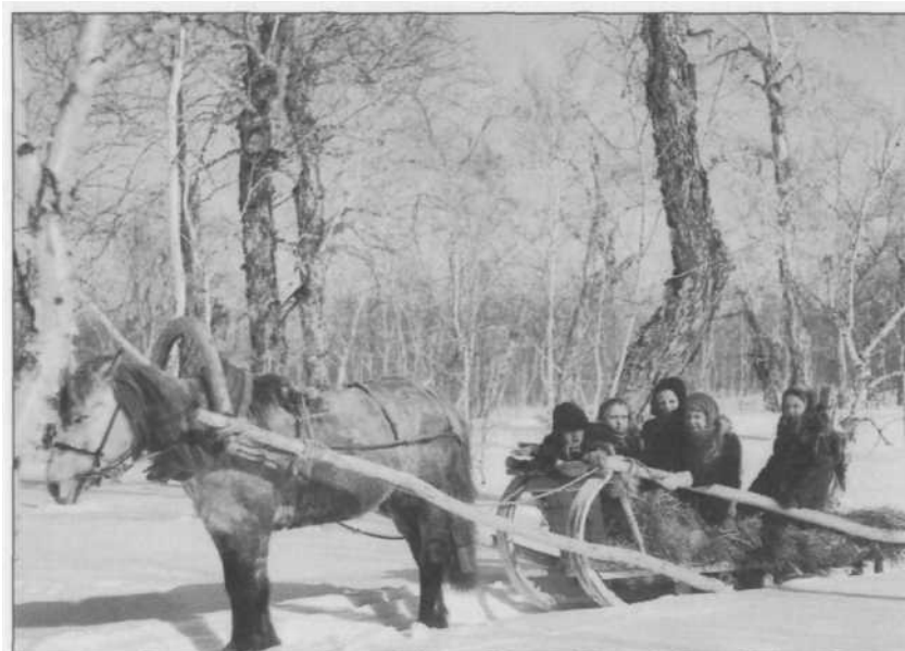
Зимние развлечения детей вулканостанции.

Обратно в Москву мы вернулись в октябре 1954 г. Летели на самолете примерно неделю с посадками и ночевками в Петропавловске-Камчатском, Магадане, Хабаровске, Иркутске и Свердловске.