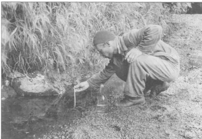
Работа на термальных площадях. Конец 30-х — начало 40-х годов.