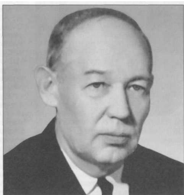
Борис Иванович Пийп (1906–1966).

Борис Иванович Пийп — член-корреспондент АН СССР, геолог и вулканолог с мировой известностью, организатор и первый директор Института вулканологии АН СССР на Камчатке. Имя ученого присвоено бульвару, на котором находится институт.