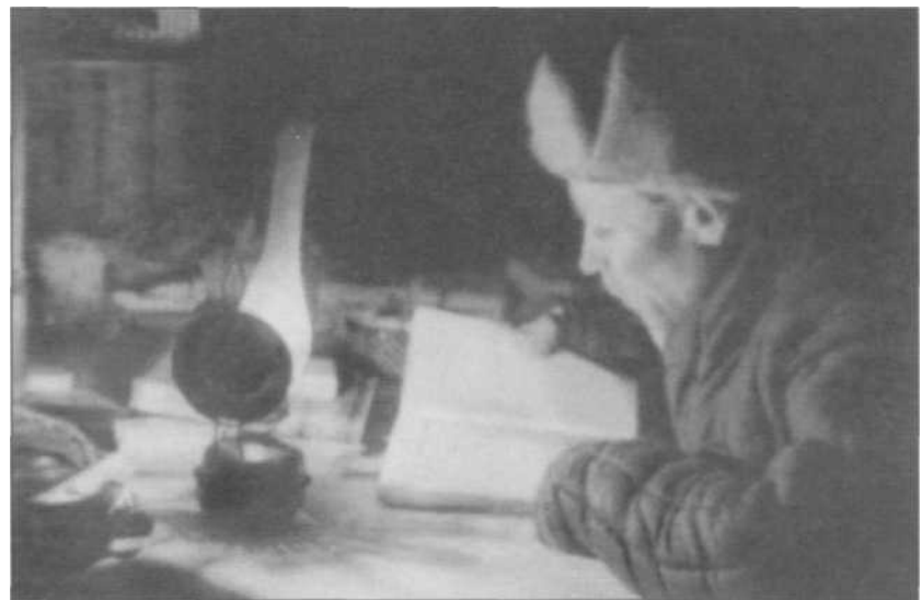
На Камчатской вулканостанции во время войны.