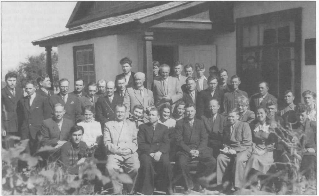
Участники Вулканологического совещания на вулканостанции в Ключах. 1955 г.