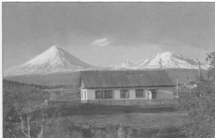
Здание лаборатории на фоне Ключевской группы вулканов.