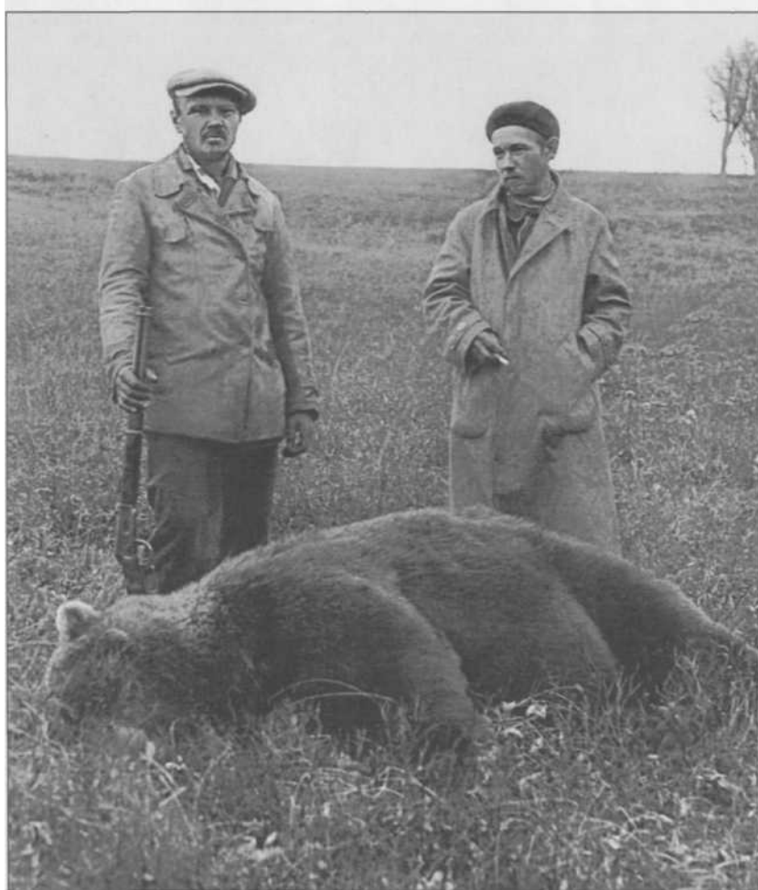
Основной продукт питания — медведи.

да стоял голод, и многие люди, спасаясь от него, ехали на Камчатку работать. Вербованные размещались в трюме и на палубе. Единственную очень маленькую каюту на пароходе занимала наша семья. Пароход остановился на рейде Усть-Камчатска, и людей в большой «корзине» спускали на плоскую, без каких-либо перил баржу и везли на берег. На поверхности моря плавали небольшие круглые снежно-ледяные лепешки, которые назывались «сало». Из Усть-Камчатска в Ключи ехали два дня по замерзшей реке на двух собачьих упряжках. Это было в апреле, а река была подо льдом. Помню, как шутили местные каюры: «Усть-Камчатск — это Ленинград, а Ключи — Москва». В Ключах мы с сестрой сразу пошли в школу, где проучились 4,5 года.